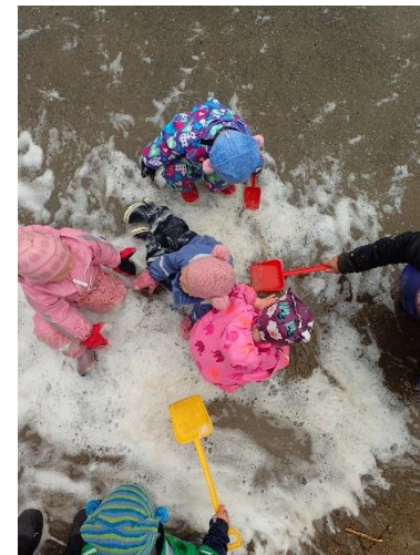
Vi bruker forskjellige teknikker når vi arbeider, vi leker og lærer av hverandre.