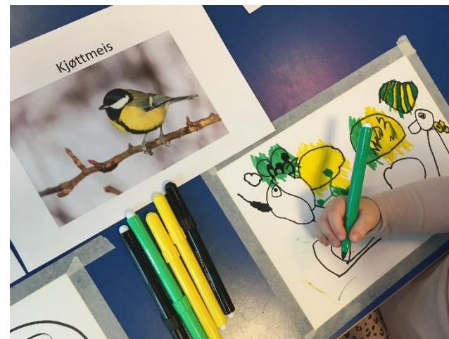
«Kjøttmeisen har fleire farga»

Planene i barnehagen er interne planer, men innholdet og arbeidet men planen vil vises i ukeslutter og informasjon om dagen, som sendes ut i foreldreappen.