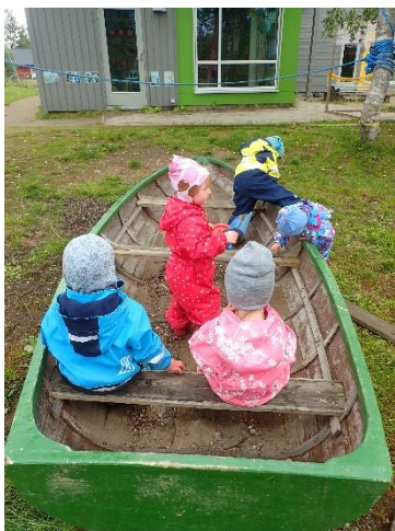
«no ska vi ut å fesk»