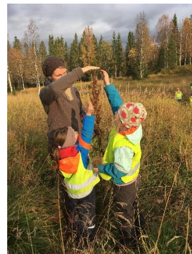
«kor høg e den?»