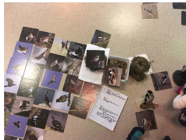
Barnemøte om fugler.