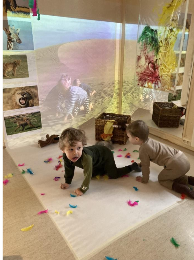
På bevegelsesrommet møter barna et miljø som innbyr til lek, bevegelse, dans og drama.