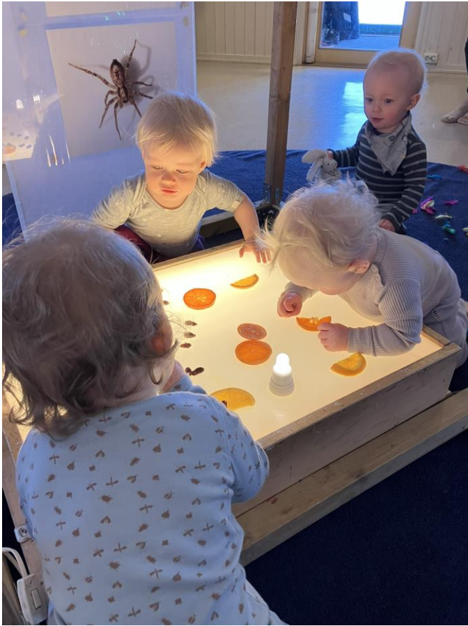
Barna skal møte noe nytt og spennende hver dag i gangen