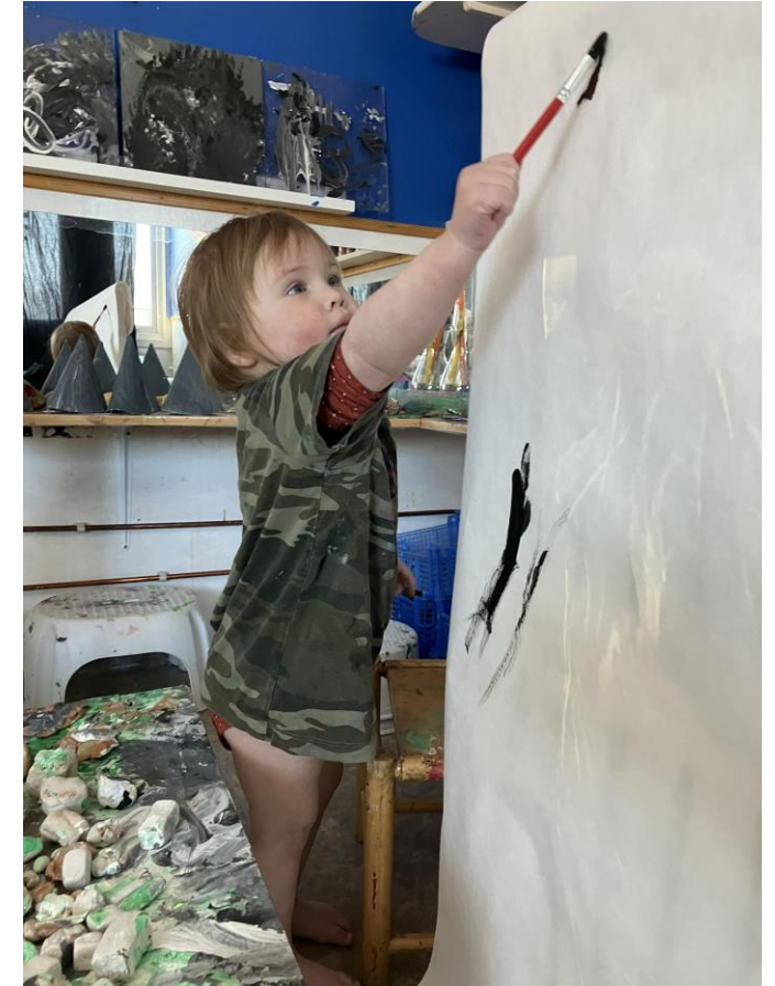
Barna møter maling med forskjellige materialer