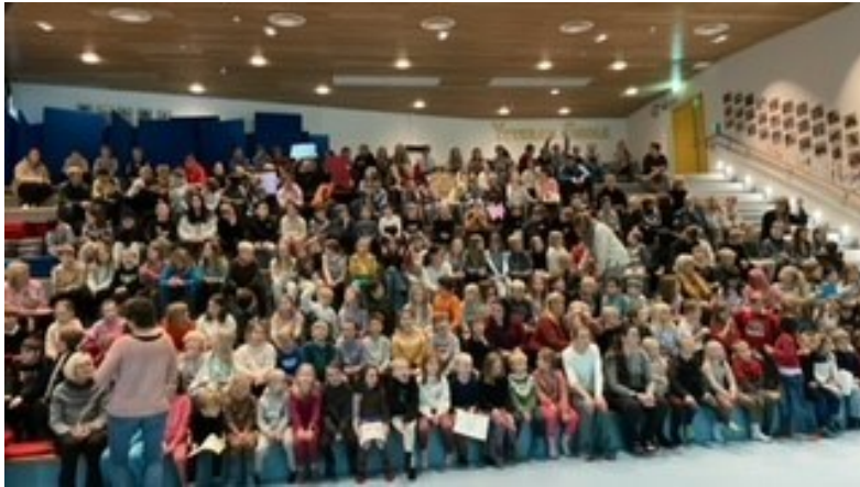
Fra fllessamling i Amfiet