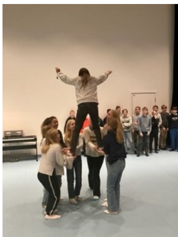
Danseprosjekt for 7.tr

Det er også viktig at vi har en god grunnbemanning slik at det er rom for intensiv opplæring før vansker får utvikle seg.