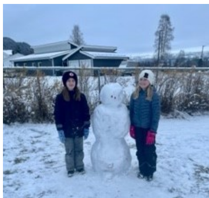
Endelig kom snøen