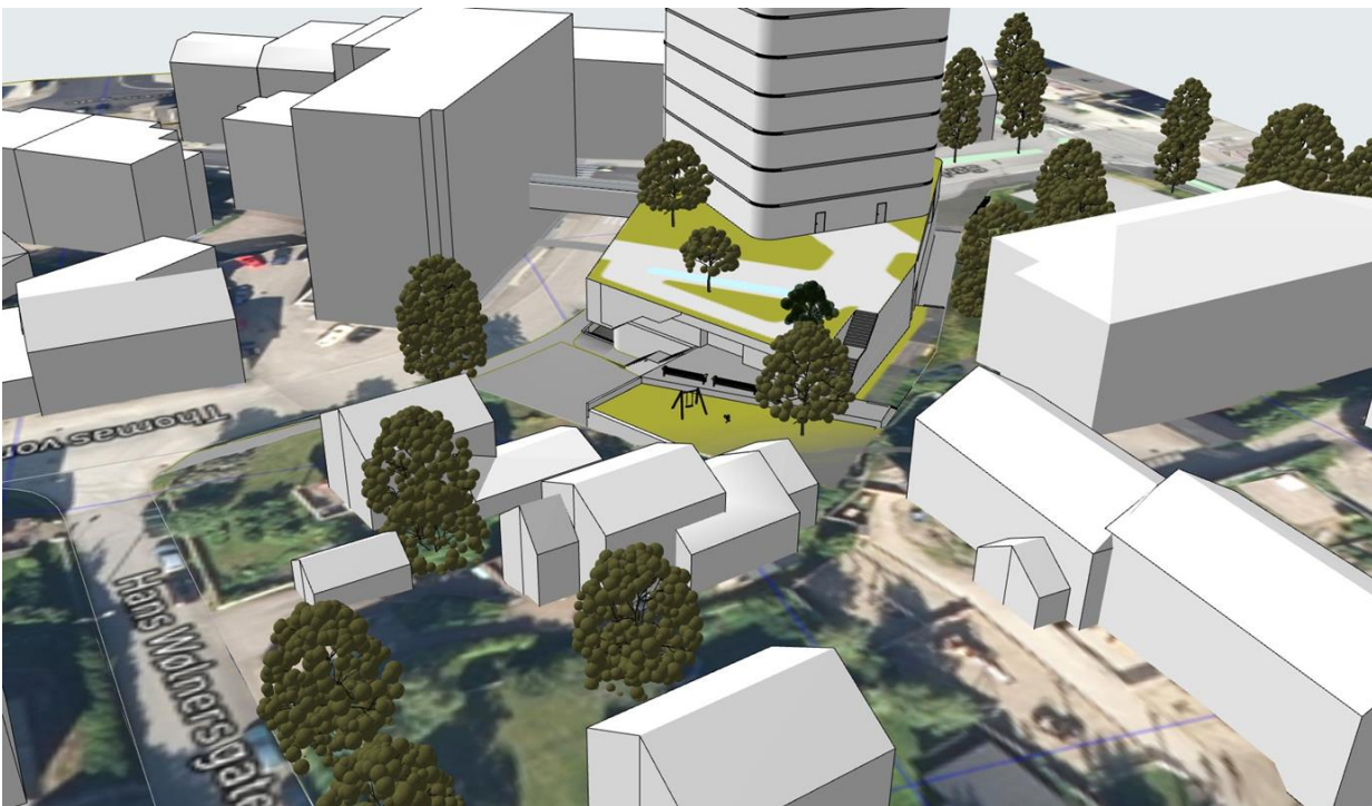
Figur 2 Kirketunet barnehage og Mo bo- og servicesenter til høyre