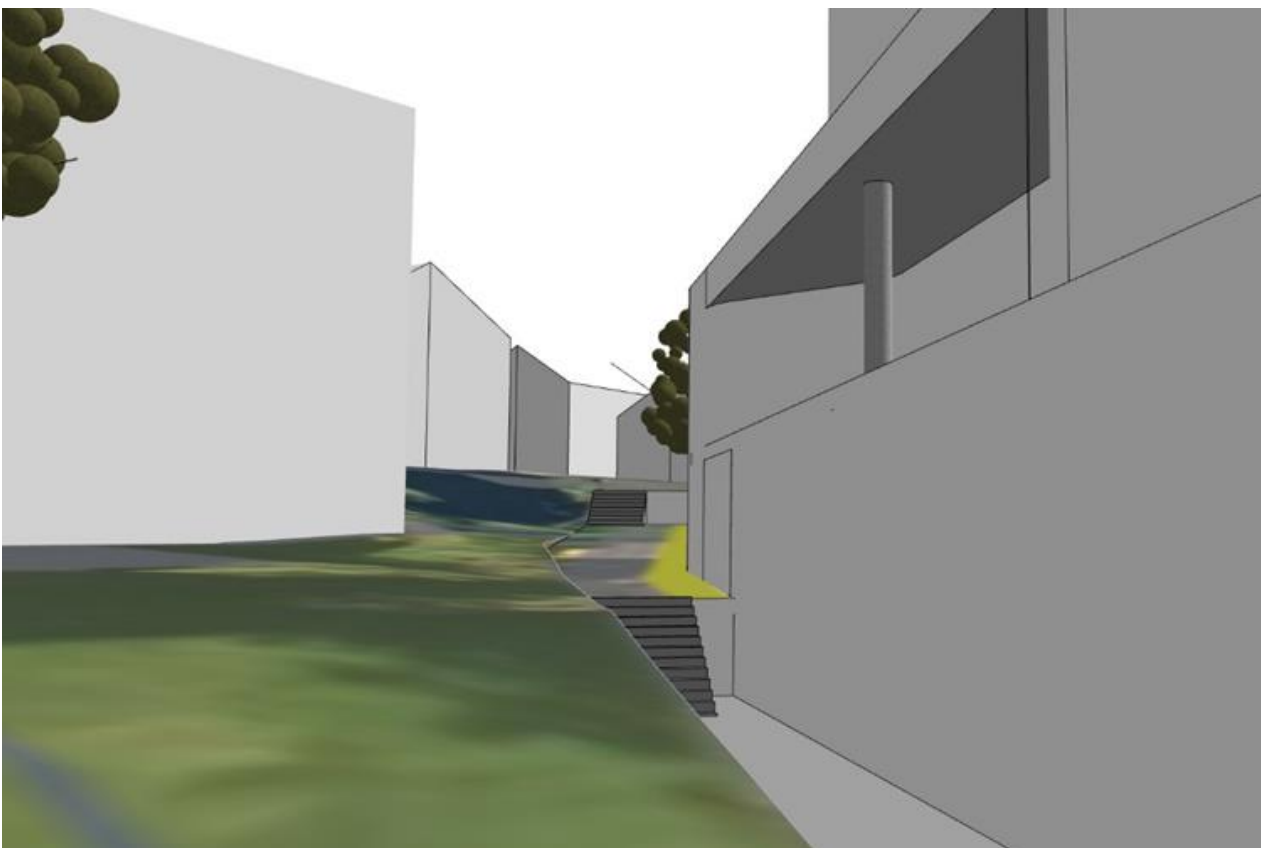
Figur 1 Mo bo- og servicesenter til venstre, utendørs adkomst til takhage til høyre