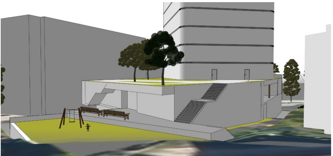
Figur 3 Lekeområde på lokk over parkeringskjeller sett fra barnehagens tomtgrense.