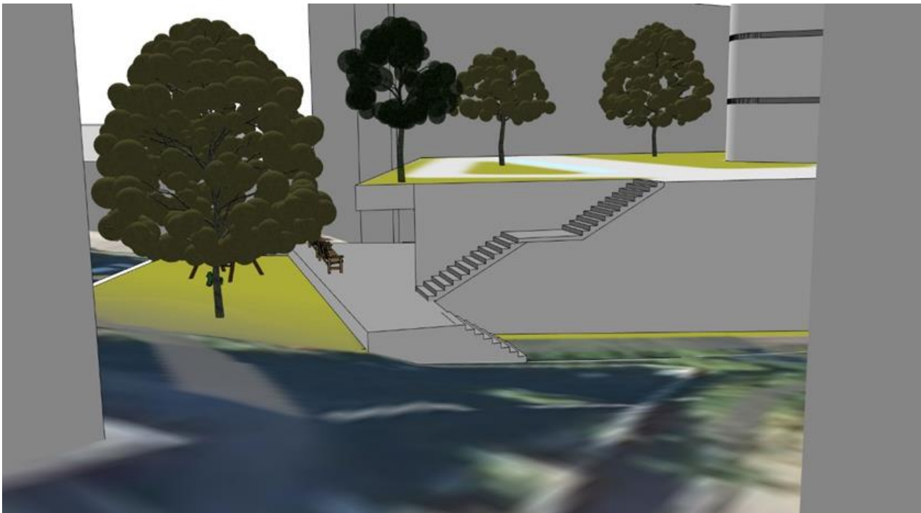
Figur 2 Barnehagen til venstre, bo- og servicesenteret til høyre. Adkomst til takhage og lekeområde.