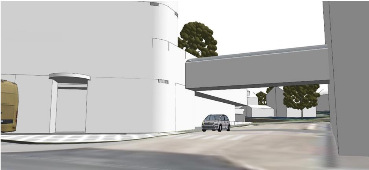
Figur 3 Hovedinngang til venstre, gangbru over Thomas von Westens gate til høyre