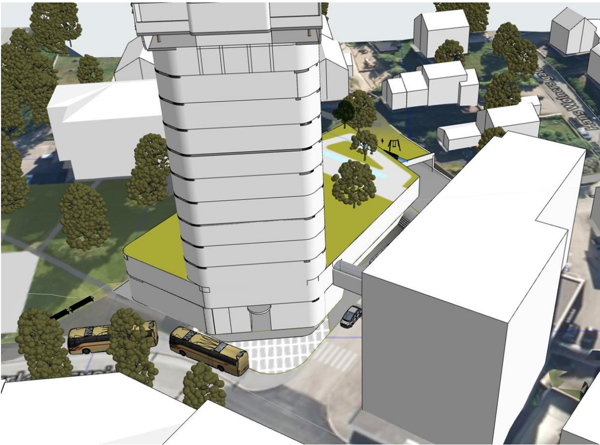
Figur 1 Krysset Thomas von Westens gate/Sørlandsveien i forgrunnen. Dagens Helma hotell til høyre.