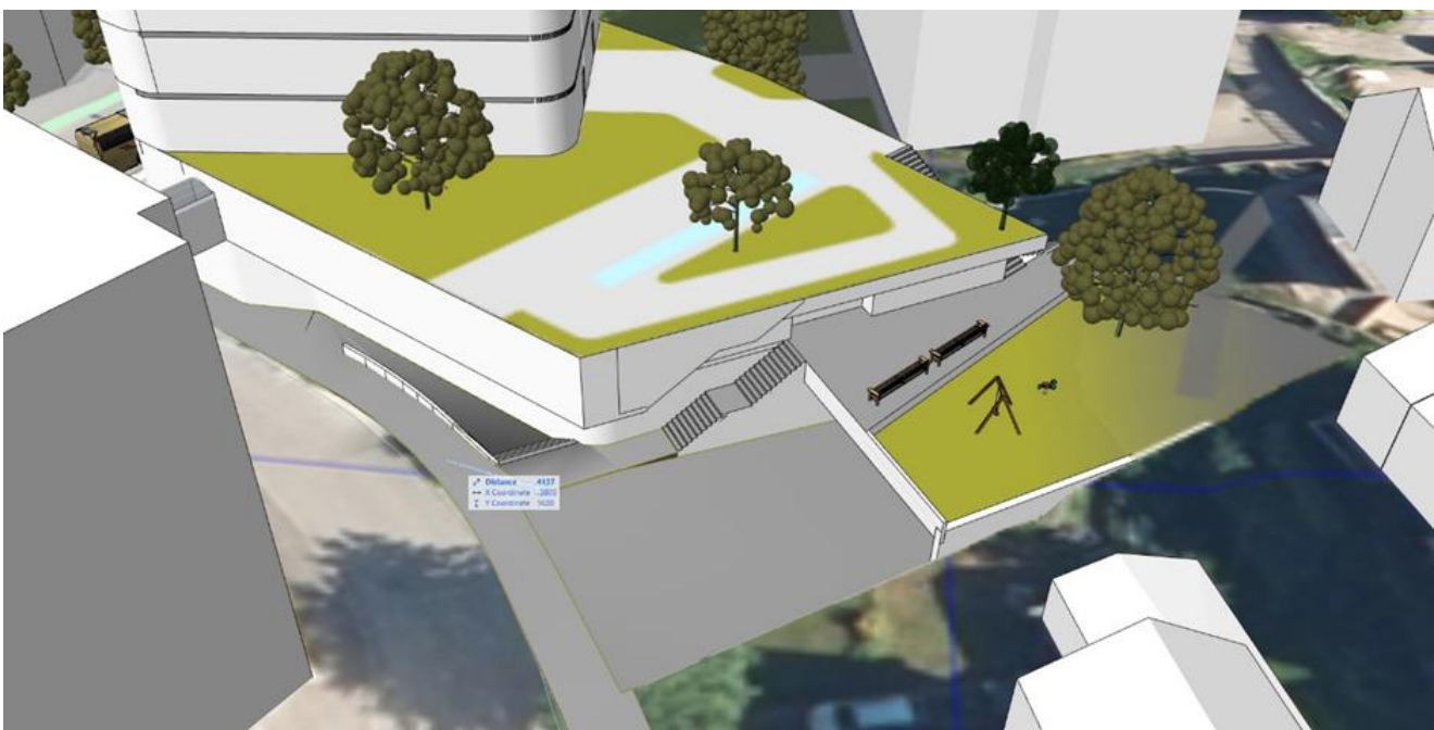
Figur 6 Som figur 5, sett mer ovenfra