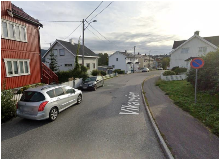
Figur 1. Biler som parkerer i gateløpet i Vikaveien, september 2022 (Google Street View, 2024).