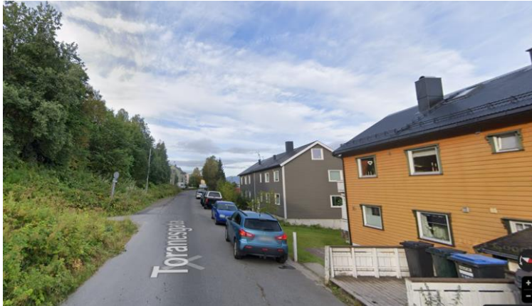
Figur 1. Biler som parkerer i gateløpet, Toranesgata, september 2022