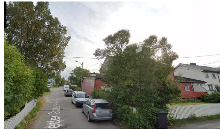
Figur 2. Biler som parkerer i gateløpet, Petter Grubens gate, september 2022