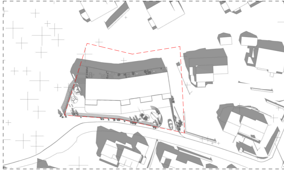
21.03.22 kl: 12.00