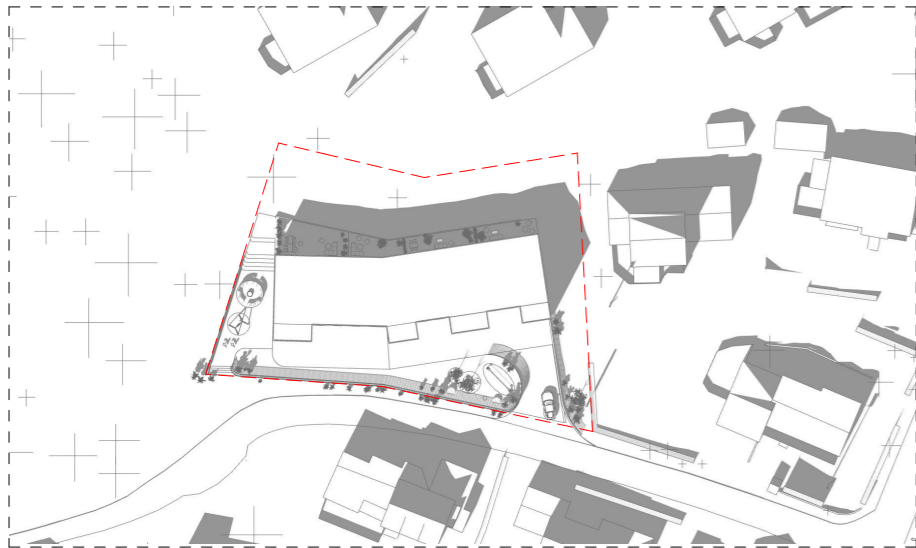
21.03.22 kl: 15.00